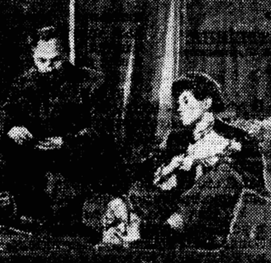
КОРОТКО О КНИЖАХ