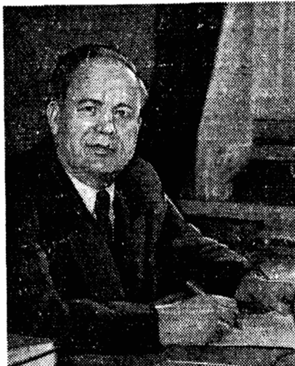
Кандидат в депутаты Верховного Совета СССР председатель Союза писателей республики Петр Устинович Бровка. Он будет баллотироваться в Совет Союза Верховного Совета СССР по Новогородскому избирательному округу.